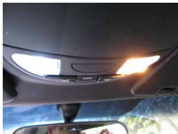
Choix 1 à gauche, choix 3 à droite