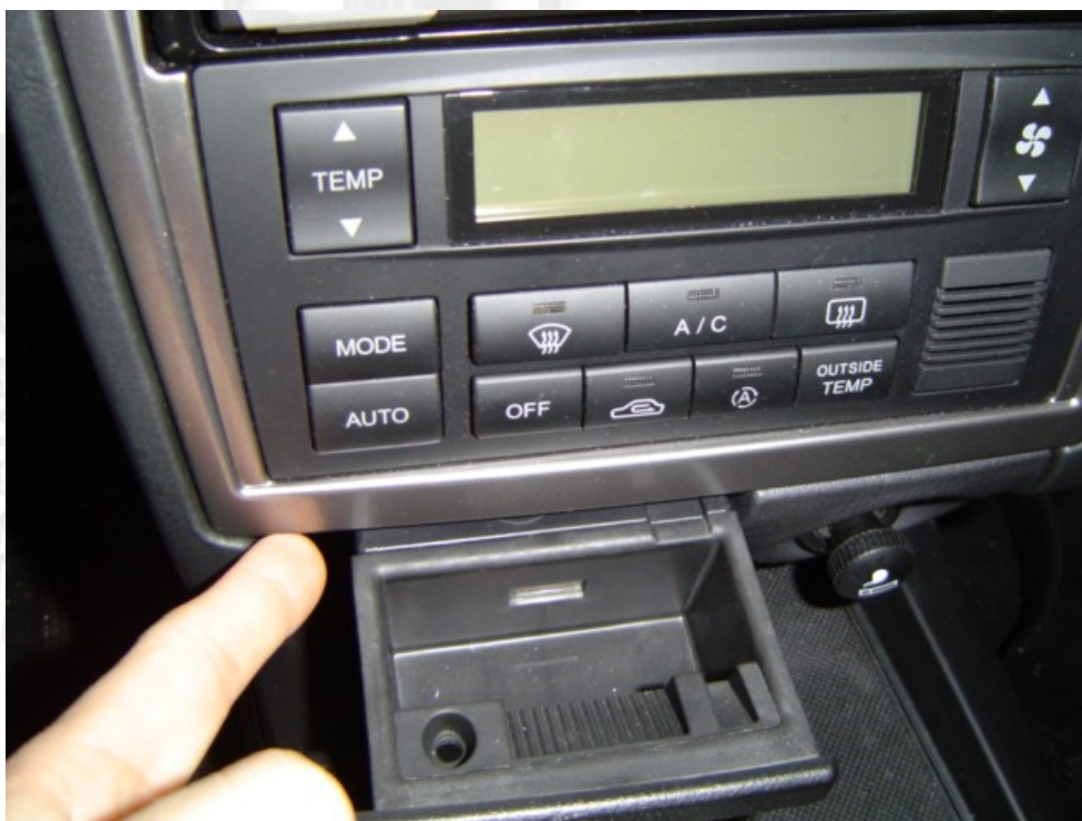
2/ tirer sur la console en alu