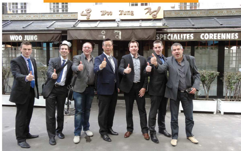
Le club remercie tout le staff de Hyundai Motor France.